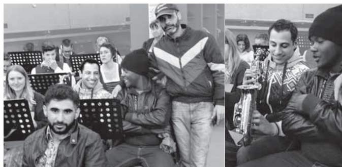
Auch unsere neuen Bewohner vom Hafenthal waren mit Freude beim Maibaumaufstellen dabei und fühlten sich beim anschließenden gemütlichen Beisammensein sehr wohl.