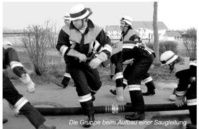
Die Gruppe beim Aufbau einer Saugleitung

Am Mittwoch, 16. April 2003, legten 3 Gruppen der Feuerwehr Lauben-Heising das Leistungsabzeichen ab. Die Leistungsprüfung dient der Vertiefung und dem Erhalt der Kenntnisse nach der Feuerwehrdienstvorschrift. Ihr Ziel ist die Leistung der Gruppe, die sich aus Arbeit und Zeit zusammensetzt. Die gründliche Ausbildung jedes einzelnen Teilnehmers ist deshalb wichtigste Voraussetzung für eine Beteiligung an der Leistungsprüfung. Zu diesem Zweck wurden die Teilnehmer an mehreren zusätzlichen Übungsabenden auf die Prüfung vorbereitet.