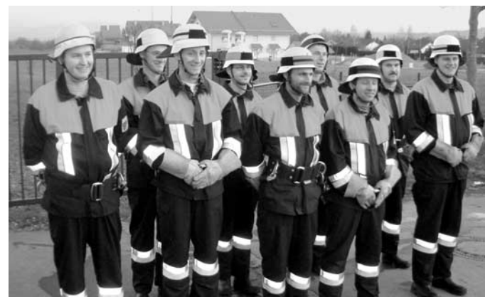
Eine Löschgruppe nach dem Bestehen der Leistungsprüfung