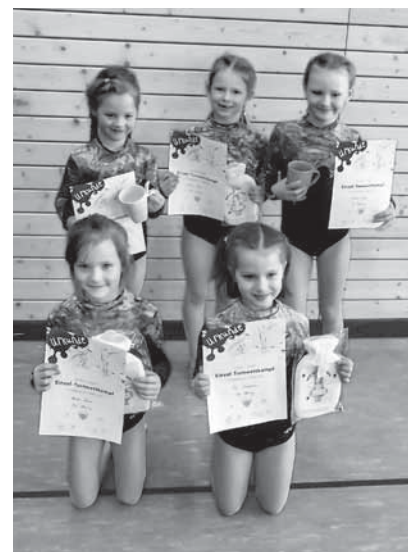
Die fünf strahlenden Siegerinnen