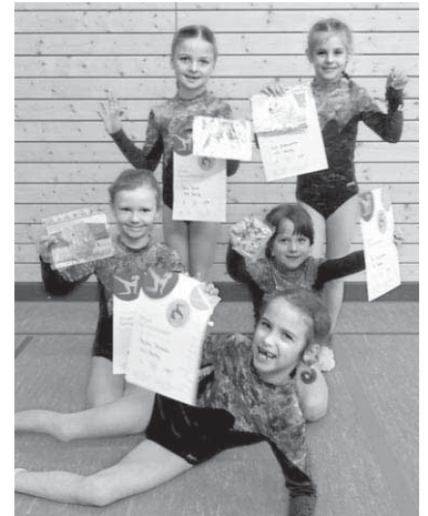
Die stolzen Gewinnerinnen