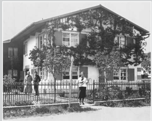
Die Aufnahme aus dem Jahre 1933/34 zeigt das »Haus Schmolle« im Schreiners Gäßlele.