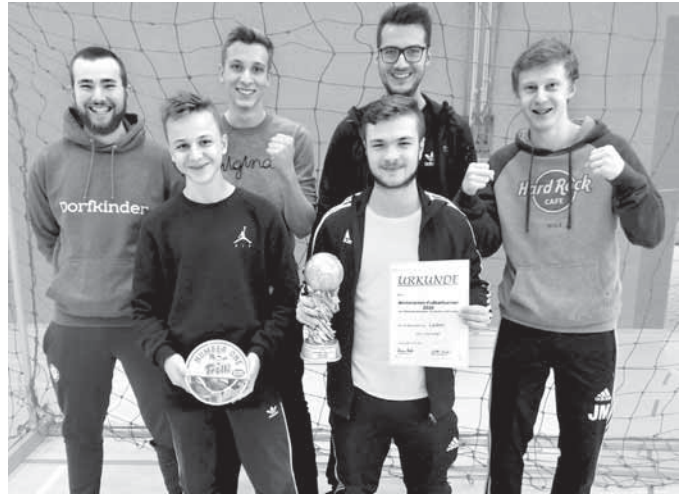
Das erfolgreiche Team

Beim jährlichen Ministranten-Fußballturnier der Regionalstelle für kirchliche Jugendarbeit erkämpften sich heuer unsere »großen Minis« (Ü 15) einen verdienten 3. Platz (von 8 sehr starken Mannschaften in dieser Altersklasse). Für mich als Zuschauer bzw. Fan (und sonst kaum Fußball-Interessierter) war es ein mitreißendes Erlebnis, unsere »Fußballjungs« (fünf aus Lauben und einer aus Börwang) in Aktion zu sehen. Insbesondere die Platzierungsspiele ließen bei allen Zuschauern die Emotionen »hochkochen«. Erschöpft, aber glücklich und zufrieden mit dem tollen Ergebnis traten wir nach der Siegerehrung den Heimweg an.