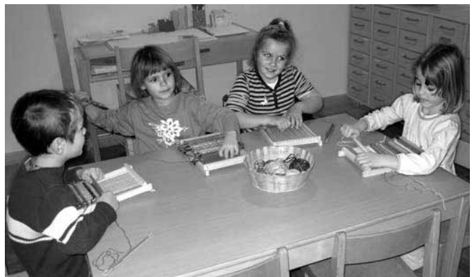
Die Superfüchse beim Weben