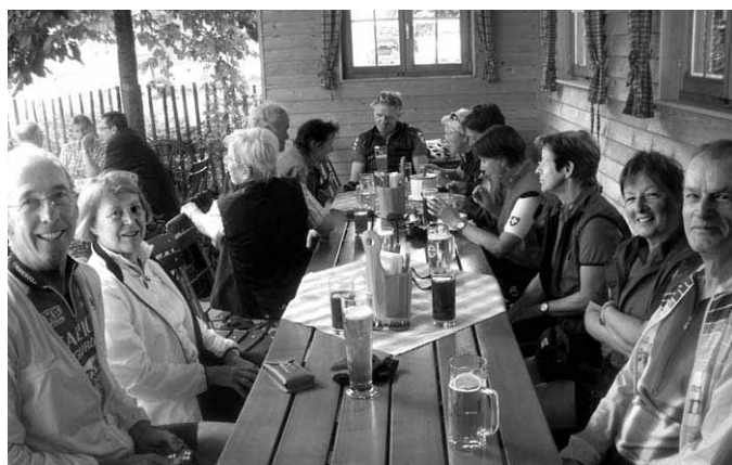
Im »Lustigen Hirsch« in Akams