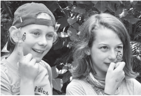
Die Schmetterlinge ruhen sich aus

leider schon zurück zum Bus mussten. Unsere Rückfahrt führte über den Obersee herum nach Überlingen, wo wir noch an der Seepromenade schlenderten und anschlie-