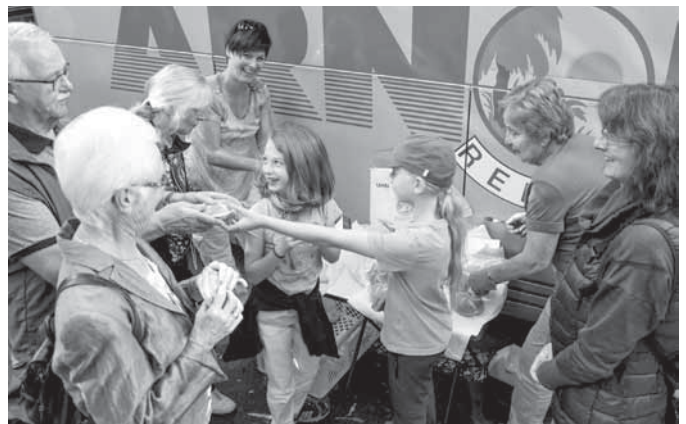
Brotzeit am Bus

Eine Fahrt für die ganze Familie. So dachten sich das zwei Familien aus Lauben und fuhren vorletzten Sonntag kurzerhand mit ihren Kindern mit zur Insel Mainau – und sie sollten Recht behalten. Begleitet von traumhaftem Wetter starteten wir mit dem voll besetzten Bus um 8.00 Uhr Richtung Meersburg. Es ging zügig voran und wir waren bereits um 10.00 Uhr auf dem Parkplatz der Fähranlage. Traditionsgemäß war es Zeit für eine kurze Pause und es gab nun erst mal eine kleine Brotzeit. Die Kinder halfen fleißig mit und so waren 60 Wurst- und Käsesemmeln schnell belegt – und auch gegessen. Anschließend setzten wir mit der Fähre nach Konstanz über.