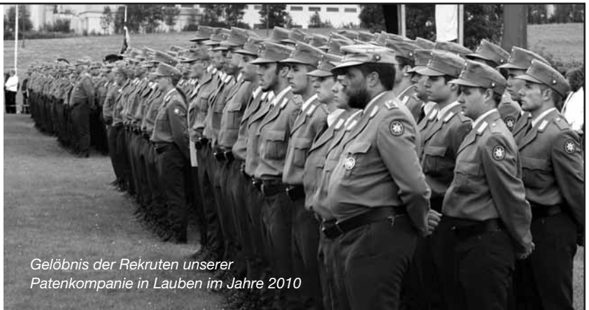
Gelöbnis der Rekruten unserer Patenkompanie in Lauben im Jahre 2010

Die gesamte Bevölkerung ist herzlich zu diesem Festakt eingeladen.