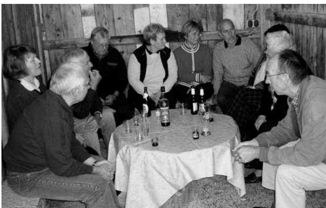
Wie früher die Hennen, saßen unsere Theatervereins-Mitglieder bei Max im »Hennaschtall«

Nach einem guten, preiswerten und sättigendem Mittagessen, zu dem auch das Löschen des Durstes gehörte, schnappten wir uns wieder unsere Drahtesel zur Weiterfahrt. Die Straße war trocken, aber es tröpfelte noch immer. Auf dem alten Bahn-