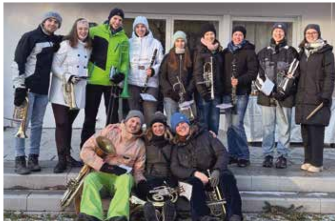
Eine Neujahrsbläser-Gruppe der Musikkapelle Lauben-Heising

Die Musikerinnen und Musiker der Musikkapelle Lauben-Heising waren in den Tagen vor Silvester in kleinen Gruppen als Neujahrsbläser im Gemeindegebiet unterwegs. Ein herzlicher Dank gilt allen Bürgerinnen und Bürgern, die uns die Türen geöffnet, unseren musikalischen Neujahrsgrüßen gelauscht und die Kapelle mit einer Spende unterstützt haben. Allen, die wir nicht persönlich antreffen konnten, wünschen wir auf diesem Wege ebenfalls ein frohes, gesundes und glückliches neues Jahr. Wir freuen uns darauf, Sie bei unseren Veranstaltungen im Laufe des Jahres wieder begrüßen zu dürfen.