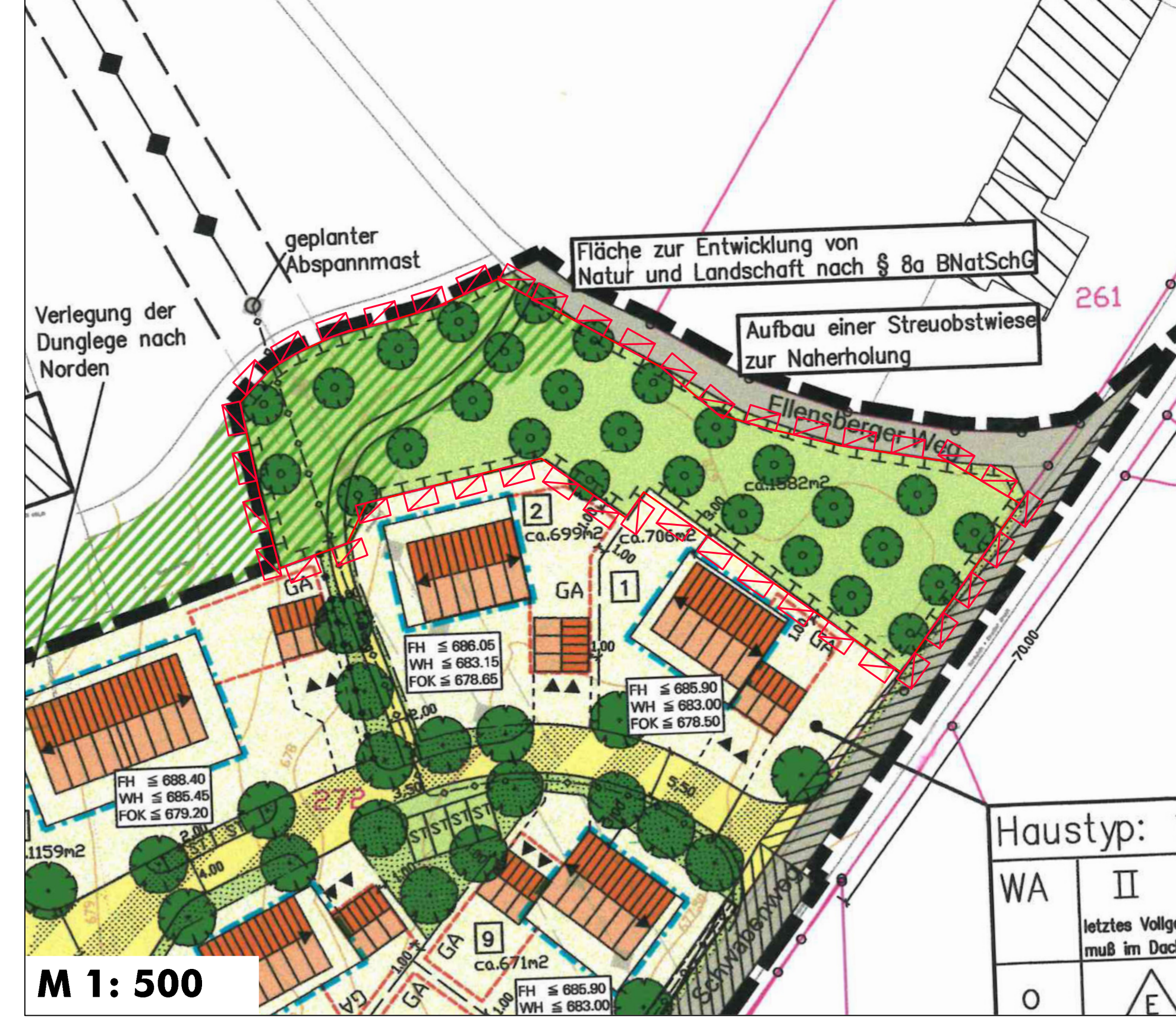
M 1: 500 Bebauungsplan "Am Schwabenweg" (Fassung vom 18.10.2000)