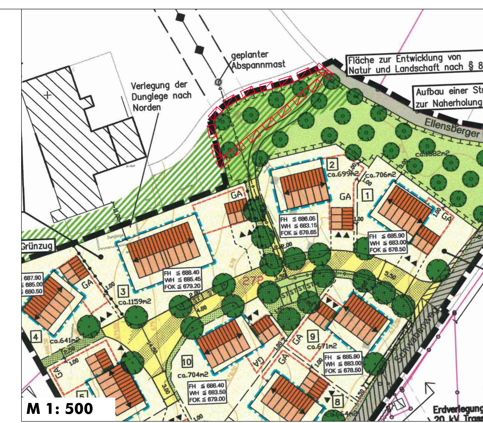
M 1: 500 Bebauungsplan "Am Schwabenweg" (Fassung vom 18.10.2000)