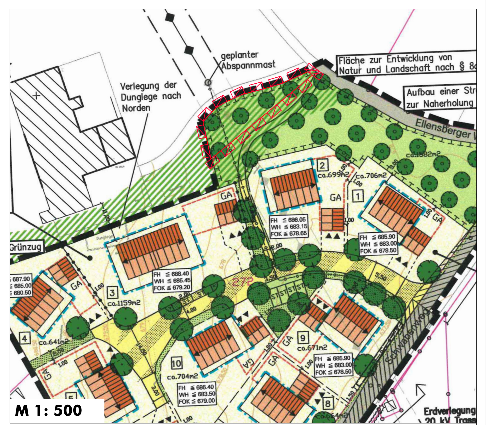
M 1: 500 Bebauungsplan "Am Schwabenweg" (Fassung vom 18.10.2000)