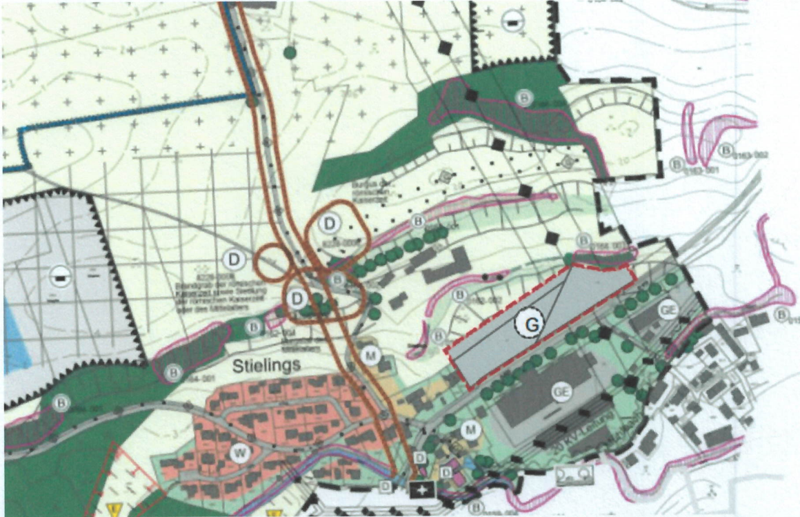
Lageplan 10. Flächennutzungsplanänderung mit Abgrenzung Geltungsbereich. Genordet. Ohne Maßstab.

Es wird darauf hingewiesen, dass zur Bearbeitung abgegebener Stellungnahmen die angegebenen personenbezogenen Daten auf Grundlage von Art. 4 Bayerisches Datenschutzgesetz (BayDSG) gespeichert werden. Die abwägungsrelevanten Inhalte der vorgebrachten Stellungnahmen werden anonymisiert aufbereitet und den zuständigen Gremien in teils öffentlichen Sitzungen vorgelegt.