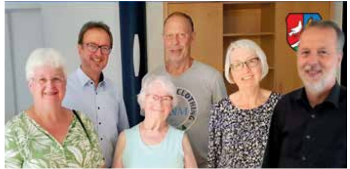
Das Vorstandsteam des VdK-Ortsverbandes Dietmannsried

Bitte beachten: Die Umfrage endet am 27. März 2026.