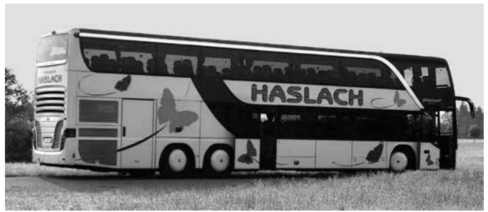
Ausflug mit dem Bus zum Erlebins-Bauernhof Kiechle

Unter der kostenfreien Hotline 0800/809 802 400 können Betroffene eine Vor-Ort-Beratung vereinbaren. Dabei sollten sie angeben, dass sie von der Flut betroffen sind. Dann werden sie bei der Terminvergabe bevorzugt berücksichtigt. Eine Online-Anmeldung ist ebenfalls möglich unter www.verbraucherzentrale-bayern.de/energie/kostenfreie-energieberatung-fuer-flutopfer-96197 . Nützliche Informationen erhalten Verbraucher auch unter www.verbraucherzentrale-energieberatung.de . Weitere Online-Vorträge zu Energiethemen sind unter www.verbraucherzentrale-energieberatung.de/veranstaltungen zu finden. Die Energieberatung der Verbraucherzentrale wird gefördert vom Bundesministerium für Wirtschaft und Klimaschutz.