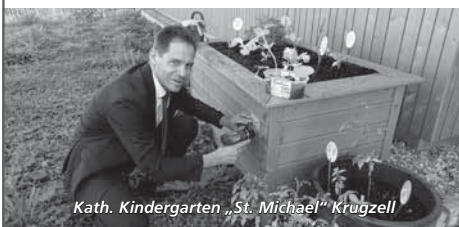
Kath. Kindergarten „St. Michael“ Krugzell

Wir wünschen allen Kindern und Erzieherinnen auch in den nächsten Jahren viel Spaß und Erfolg beim Gärtnern!