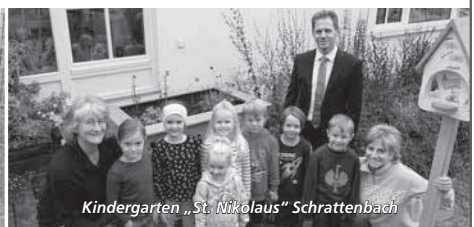
Kindergarten „St. Nikolaus“ Schratzenbach