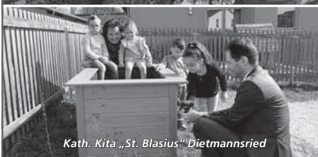
Kath. Kita „St. Blasius“ Dietmannsried