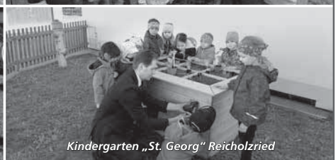
Kindergarten „St. Georg“ Reicholzried