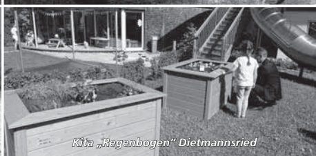
Kita „Regenbogen“ Dietmannsried