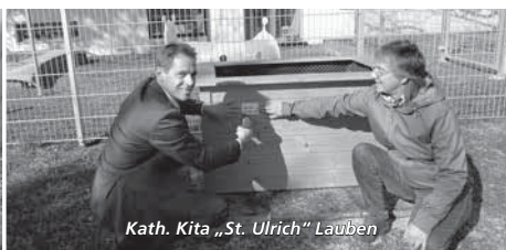
Kath. Kita „St. Ulrich“ Lauben