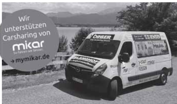
So ähnlich soll der neue CarSharing-Bus für Lauben aussehen. (Beispielbild: CarSharing-Fahrzeug Standort Füssen)

Schluss mit Fragen wie: Wer fährt? Woher bekommen wir einen Bus? Passen wir alle rein? Ach, Gepäck ist auch noch dabei, und so weiter.