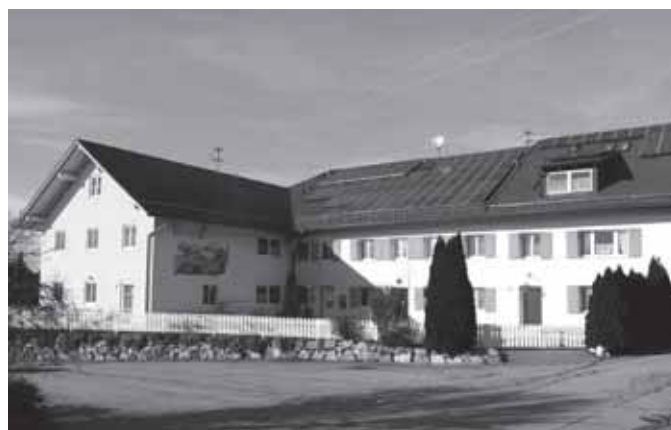
BRK Sonnenhof in Lauben