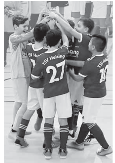
Pokalübergabe bei der Siegerehrung