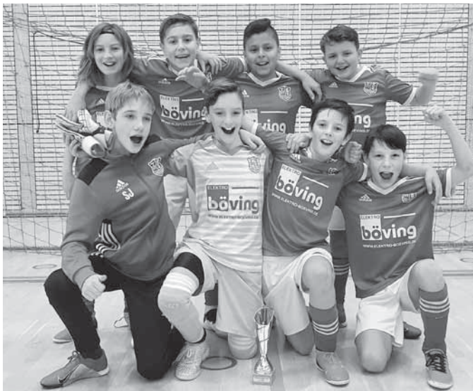
Turniersieger TSV Heising