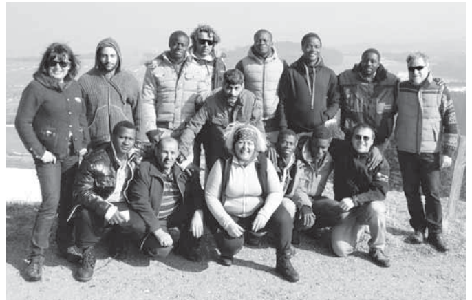
Sonntagsausflug – Wanderung von Wegscheidel auf den Blender – für viele der erste Kontakt mit Schnee