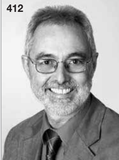
Berthold Ziegler 1. Bürgermeister